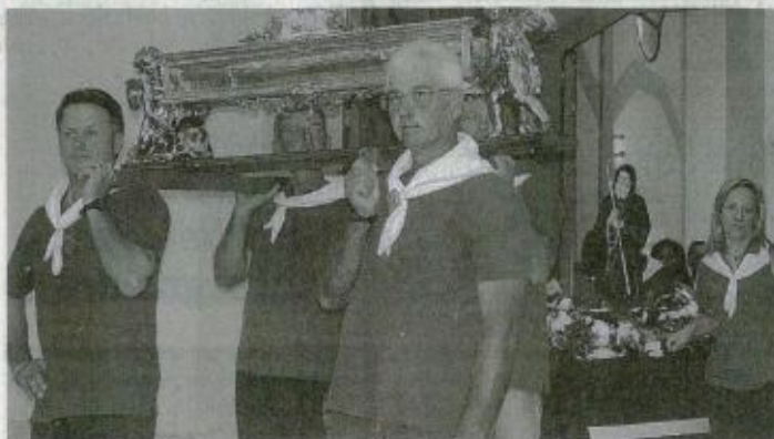
La processione esce dalla chiesa della Madonna delle Grazie